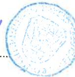
Andreas Weiß Bürgermeister