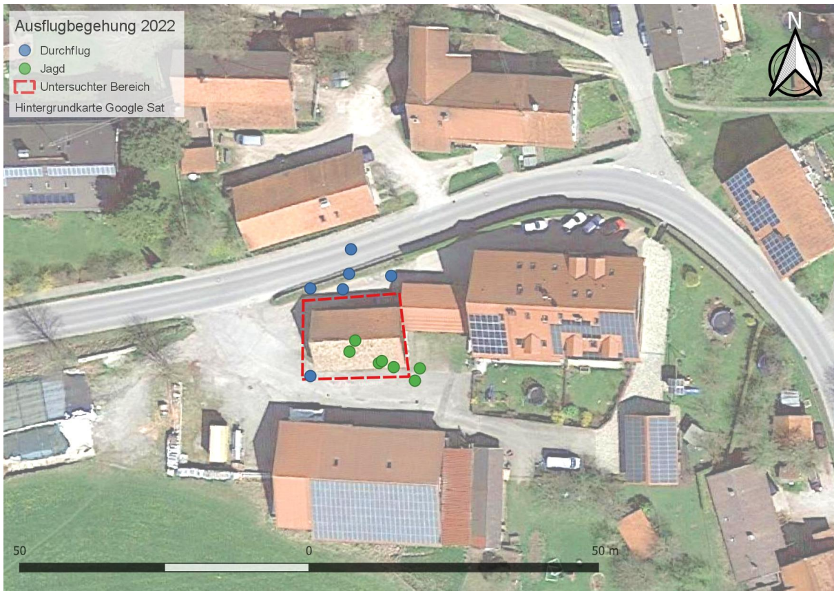
Abb. 3: Zwergfledermaussichtungen am Gebäude 2022.

Die Zwergfledermaus ist nicht Teil der Roten Listen. Der Erhaltungszustand für die kontinentale biogeografischen Region (EHZK) wird bei der Zwergfledermaus als gut (g) beschrieben. Sie ist auch eine Art des Anhangs IV der Flora-Fauna-Habitat Richtlinie.