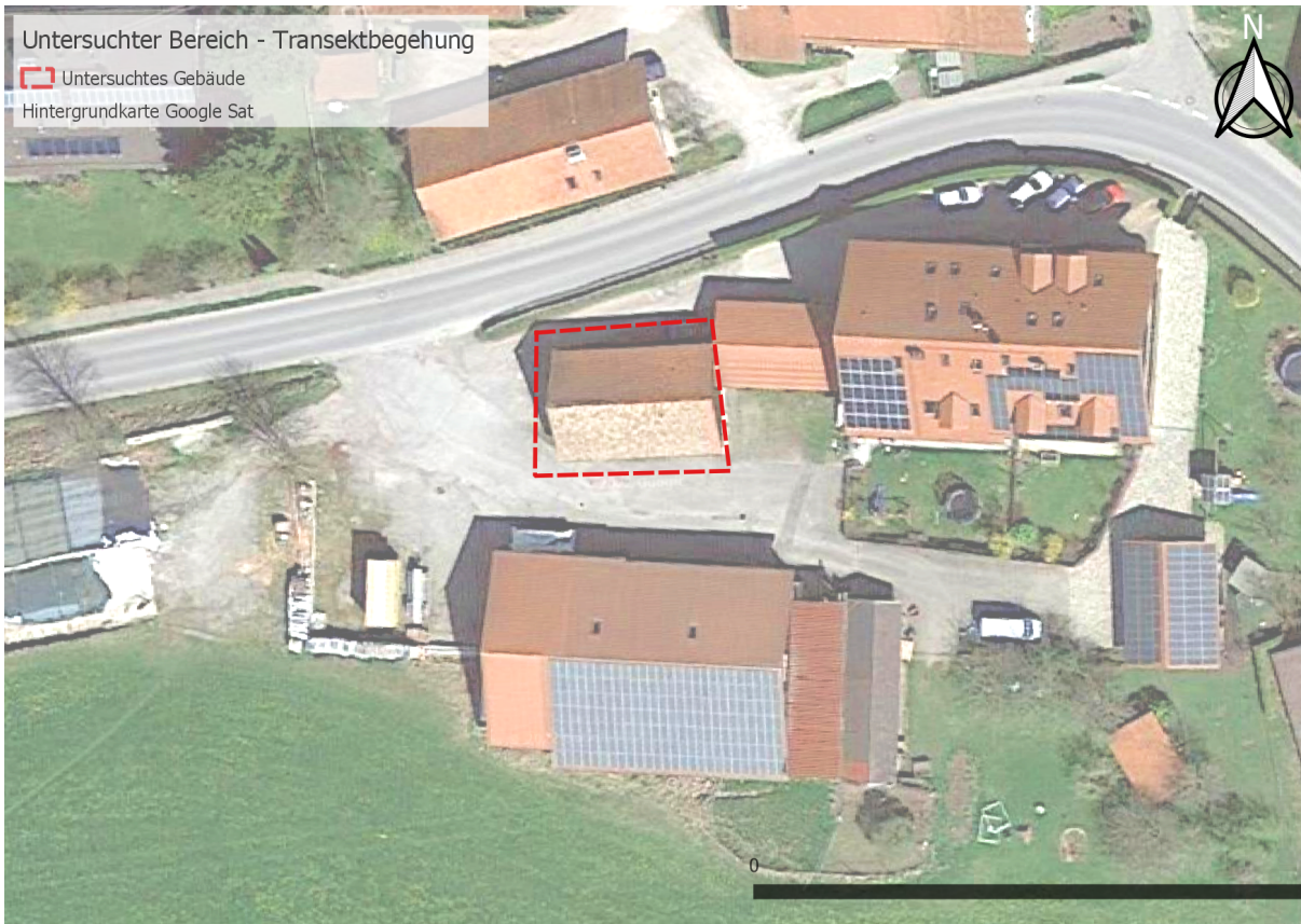
Abb. 2: Transekte der Fledermausbegehung im Untersuchungsgebiet 2021.

rodynempfänger) aufgenommen. Zu jeder Rufaufnahme wurde die GPS-Position und Temperatur verzeichnet. Bei lokaler Jagdaktivität wurde auch versucht, die Fledermäuse mittels Taschenlampe zu beobachten, um Anzahl, Größe und Merkmale registrieren zu können (s.u.).